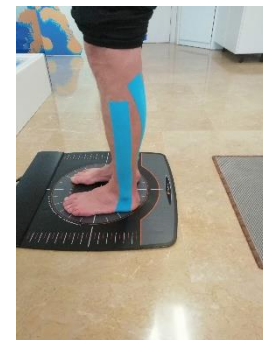
Figura 3. Medición