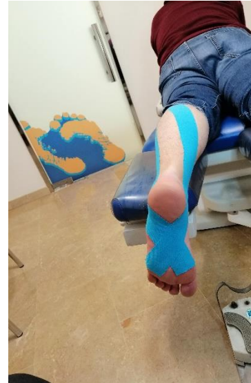
Figura 2. Vendaje kinesiotape

Los vendajes se pegan sobre la piel con los extremos sin tensión, y resto de la venda con una tensión inferior al 50% de su estiramiento máximo.