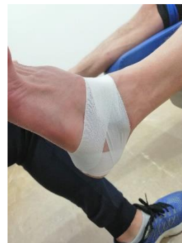
Figura 4. Vendaje tape

El equipo investigador estuvo formado por: