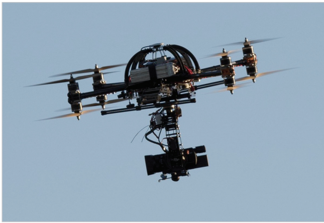
Imágenes de drones de la empresa The Drones Post