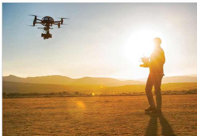
Imagen del piloto de dron de The Drones Post

Ignacio Latorre ( ENVuelo ) resalta que la obtención de la licencia es importante para que el piloto sepa si se puede volar o no: por ejemplo en un incendio no se pueden usar porque hay servicios aéreos de emergencias trabajando en la zona.