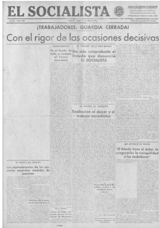
Figura 5. Portada de El Socialista . Madrid 18 de julio de 1936. Las noticias censuradas por el gobierno republicano aparecen en blanco. Ejemplar de la Fundación Pablo Iglesias. Alcalá de Henares, Madrid (Signatura: ES 1936-07-18 n-28191)