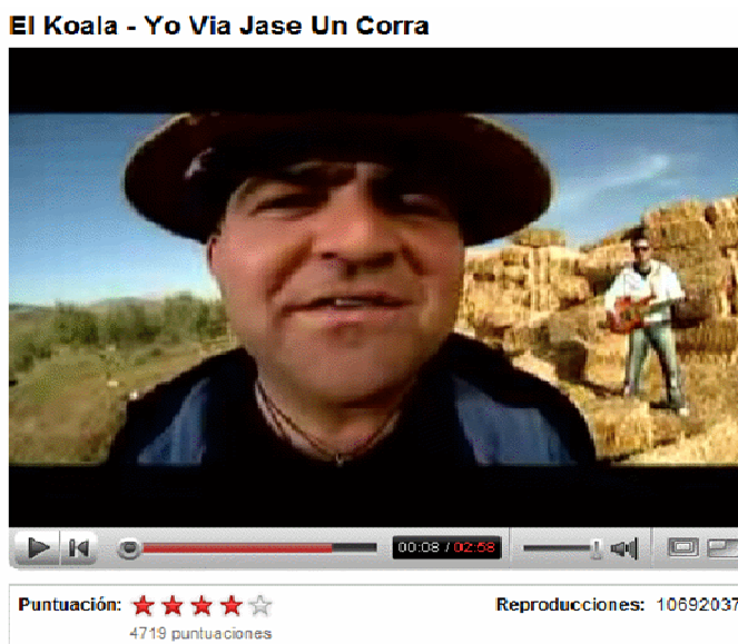
Figura 1. Ejemplo de reproductor de Youtube (captura realizada en enero de 2008)

En la Figura 1 mostramos una captura de la ventana de reproducción de Youtube tomada durante la recopilación de los datos.