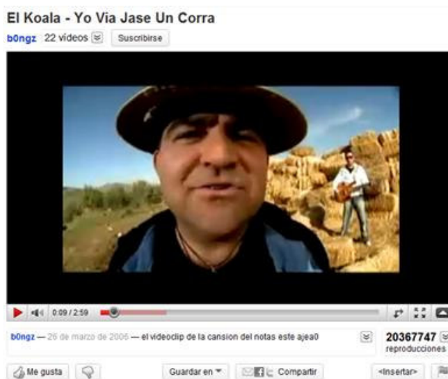
Figura 2. Ejemplo de reproductor de Youtube (captura realizada el día 09 de mayo de 2010)

Todas las muestras son recopiladas a través del propio sistema de búsqueda de Youtube. También hay que tener en cuenta que, para participar en las opciones de interacción que ofrece Youtube, el usuario necesita registrarse de manera gratuita y que los vídeos tienen una duración máxima de 10 minutos (salvo los que publican los canales promocionados, que firman acuerdos especiales con Youtube y carecen de esta limitación: como las cadenas de televisión Cuatro, RTVE, La Sexta y Antena 3). Durante la investigación y una vez recopilados los datos, Youtube modifica la interfaz gráfica de su sitio web en abril de 2010: simplifica el modelo de votación de estrellas (de una a cinco) por la votación de “me gusta” y “no me gusta” como se observa en la parte inferior izquierda de la Figura 2 (compárese con la Figura 1).