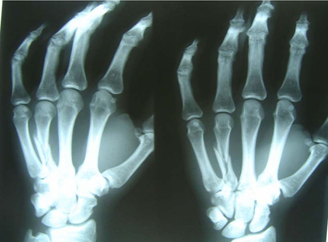
Figura 1. Fractura conminuta en el cuarto metacarpiano de la mano izquierda.

Teniendo en cuenta los signos y síntomas que aparecen reflejados en la historia del paciente y en la imagen radiológica, se realizó una intervención quirúrgica para la reducción con contención con placas de mini fragmentos (Figura 2)