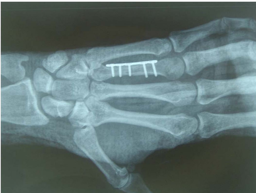
Figura 2. Reducción con contención con placas de mini fragmentos.

Teniendo en cuenta los signos y síntomas que aparecen reflejados en la historia del paciente y en la imagen radiológica, se realizó una intervención quirúrgica para la reducción con contención con placas de mini fragmentos (Figura 2)