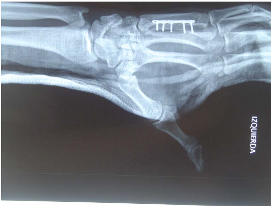
Figura 3. Primer mes desde la fractura y reducción con osteosíntesis.

Al término de esta fase, se apreció una disminución del edema en la mano, una imagen radiológica más clara y consolidación del foco de fractura (Figura 3).