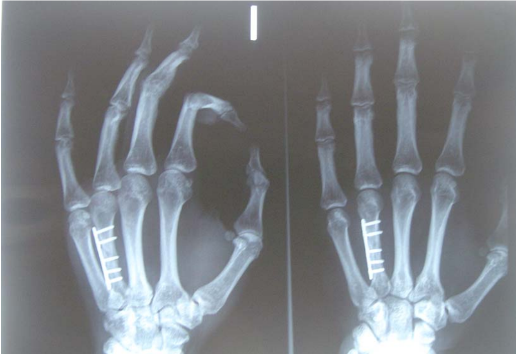
Figura 5. Tercer mes desde la fractura.

Cuatro meses después de la lesión, el paciente comenzó la actividad deportiva de forma progresiva, logrando una respuesta positiva en todos los movimientos aunque percibía una mayor dificultad en los últimos grados de flexión de la articulación metacarpofalángica e interfalángicas del cuarto dedo. Se apreció un aumento lento de fuerza, evolucionando a un grado 4 de balance muscular en antebrazo y 5 en brazo. También se consiguió un incremento importante de fuerza, especialmente en la musculatura implicada en la prensión de la mano. Este movimiento fue el que más tiempo se tardó en conseguir y sobre el que más se insistió en las sesiones de fisioterapia, llegando a conseguir un grado 4+. Fue necesaria una correcta movilización de la mano para las actividades de la vida diaria y más concretamente para el deporte que practica. (Figura 6)