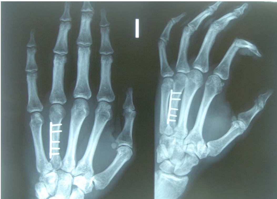
Figura 4. Segundo mes desde la fractura por estrés.

• Fase III: Periodo de esfuerzo estable. El paciente presentaba una mejoría importante en cuanto a la movilidad y fuerza del miembro afectado. Se hizo más hincapié en el trabajo de movimientos funcionales globales de miembro superior combinando movimientos angulares de hombro, codo, muñeca y mano. El balance muscular en esta fase era de grado 3 en los músculos de la mano y grado 4 en los músculos de brazo y antebrazo. El objetivo en esta fase fue conseguir la fuerza plena del segmento lesional. Con este fin, se le aplica: