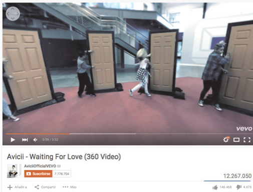
Figura 2. Videoclip de Avicii en Youtube.

guaje audiovisual, entendido este como el que se compone de palabras –orales y escritas– e imágenes en movimiento (Martínez, 2005:214).