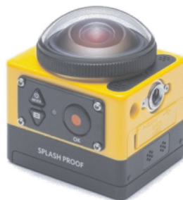
Figura 1. Cámara SP360 de Kodak.

Los fabricantes de cámaras están viendo en el vídeo esférico una oportunidad de negocio que además les permitiría adelantarse a las cámaras de acción, GoPro, su rival más claro. Este tipo de cámara esférica está formada por un conjunto de lentes que permite conseguir un amplio ángulo de visión. En la actualidad hay diferentes modelos, por ejemplo, la 360Fly, de pequeño tamaño que permite grabar durante dos horas y media una escena de 360 grados en horizontal y hasta 240 grados en vertical, pero su resolución es menor que otros modelos. Otro modelo, el de Kodak, la SP360 (Figura 1), graba en alta definición y con un ángulo vertical de 214 grados y se puede controlar inalámbricamente desde cualquier teléfono (El Mundo, 2015).