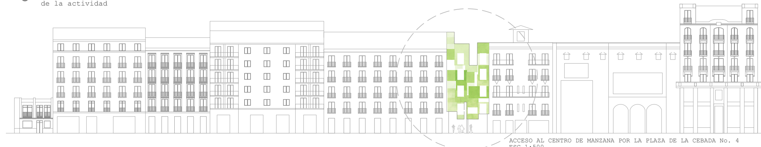
ACCESO AL CENTRO DE MANZANA POR LA PLAZA DE LA CEBADA NO. 4 ESC 1:500

Es evidente la apropiación del espacio para usos diferentes a los de habitar. Los vecinos se resisten a entregar el barrio a intereses ajenos. Es urgente trabajar de manera colaborativa como estrategia metodológica. Los habitantes deben estar preparados para cambiar de dirección según vayan cambiando los requerimientos del momento. Cada miembro es importante, cada uno brinda su conocimiento por un interés personal que al final se vuelve colectivo. Cada uno evoluciona su concepto de barrio, de ciudad a través de la transformación continua de su entorno, a través de las relaciones.