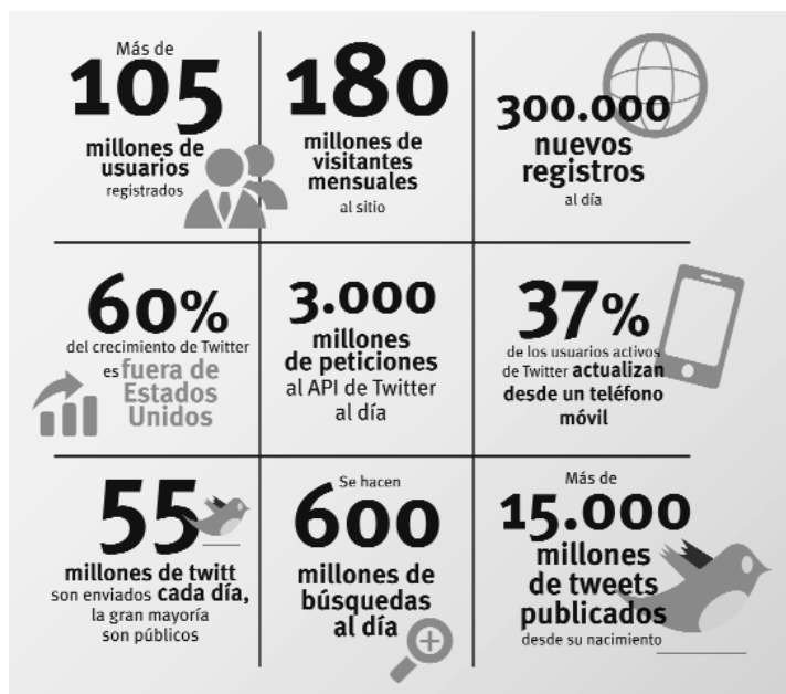
Imagen 1. Cifras del uso de Twitter

Desde su nacimiento esta red social basada en el envío de mensajes cortos de 140 caracteres, ha tenido un crecimiento vertiginoso consiguiendo las siguientes cifras: