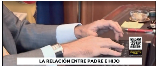
Gráfico 2. Utilización de código QR en un informativo del 23 de mayo de 2022 en Antena 3.